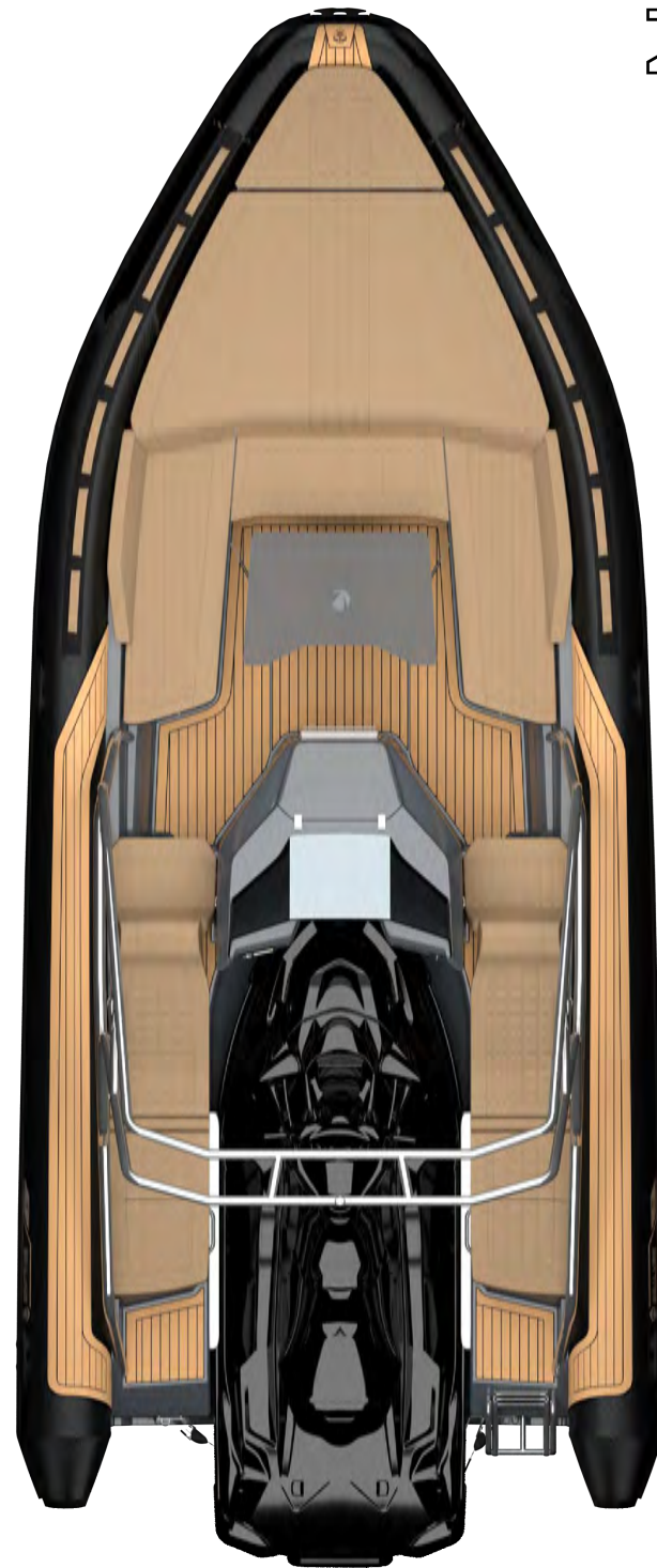
Z-8 FULL WAKE PACK