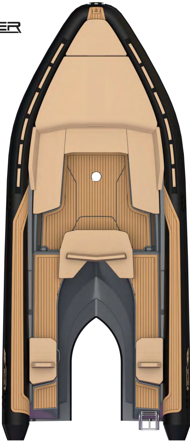
Z-8 STANDARD PACK